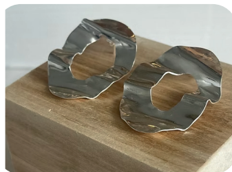
Alice CORNUAULT Bijoutière