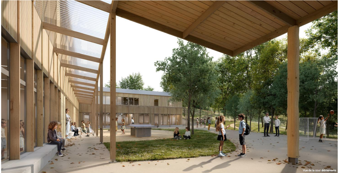
Orienté vers les vues lointaines, le bâtiment s'inscrit avec justesse dans son site et établit un dialogue étroit avec le paysage. À travers des façades protectrices, les espaces d'apprentissage se prolongent vers l'extérieur, affirmant une architecture ouverte, propice à la pratique de l'école du dehors, au sein de cours végétalisées pensées pour accueillir une diversité de pratiques.