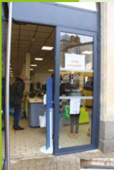
L'entrée du marché avec port du masque et gel hydroalcoolique

Au marché, un sens de circulation permet de limiter le croisement des personnes. Le port du masque y est obligatoire et chacun est invité à utiliser le gel hydro alcoolique mis à disposition à l'entrée du marché.