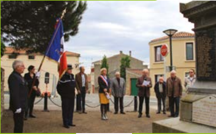
Cérémonie du 8 mai