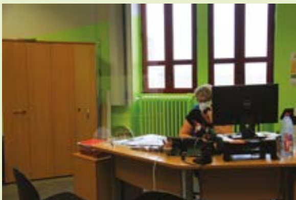
Plexiglas, masque sont de rigueur à l'accueil de la mairie