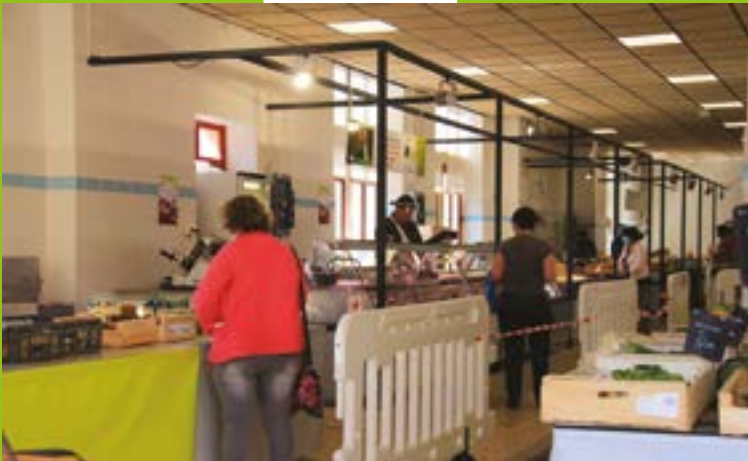
Le marché s'organise pour accueillir les clients