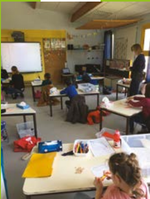
Retour des élèves à l'école Françoise Dolto