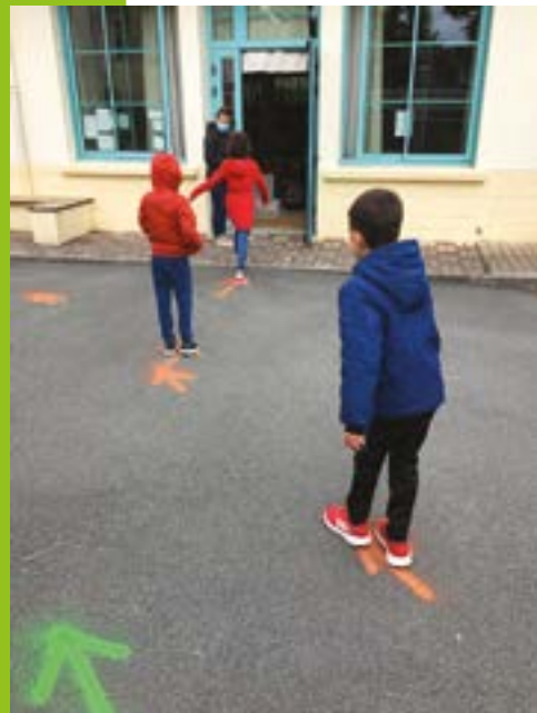
Retour des élèves à l'école Jules Verne