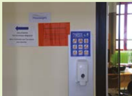
Mesures sanitaires à l'accueil de la mairie