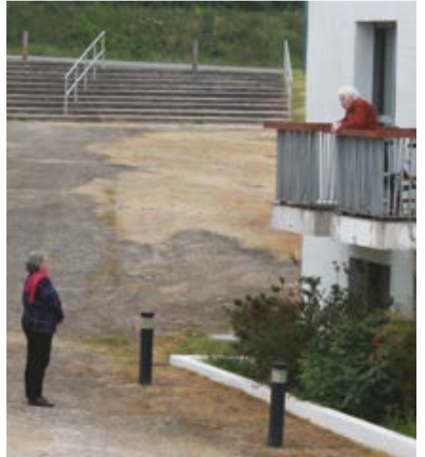
Les rendez vous au balcon à la résidence Les Collines