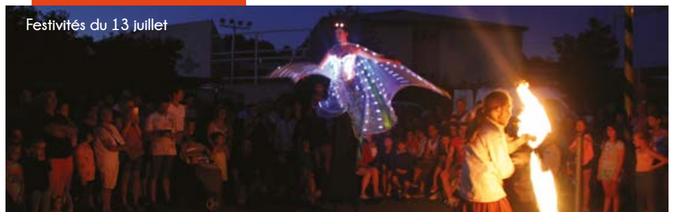
Festivités du 13 juillet