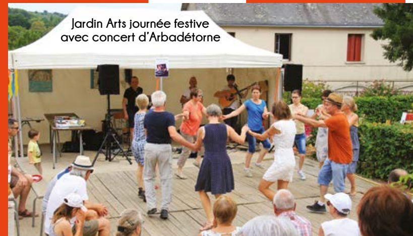
Jardin Arts journée festive avec concert d'Arbadétorne