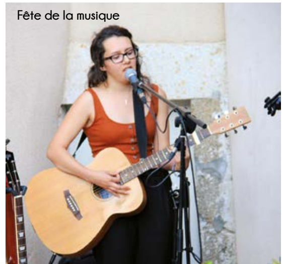
Fête de la musique