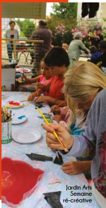
Jardin Arts Semaine ré-creative