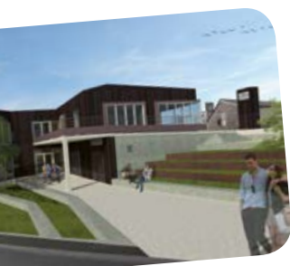
Compartiments : 12-13