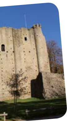
Consolidation du 2019 à juin 2020

Par contre, un certain nombre de points faciles à traiter seront mis en œuvre au plus vite. Retrouvez les dans chaque quartier, dans un encart bleu.