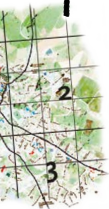
Quartier 4 de Largeteau 2021