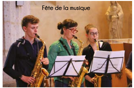
Fête de la musique