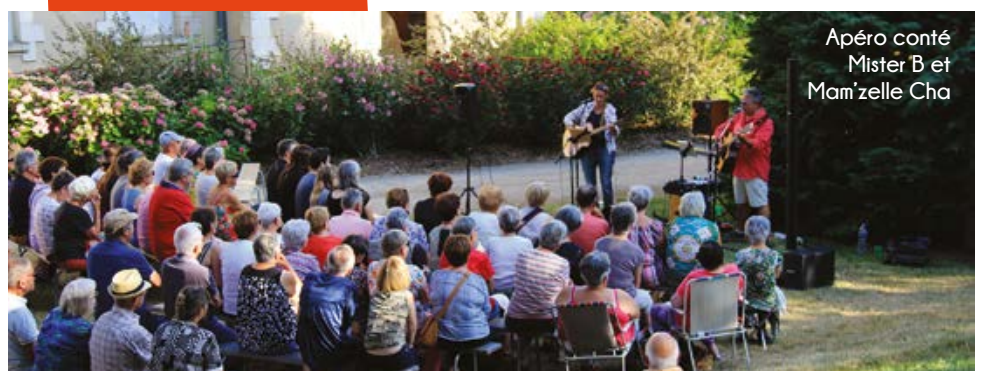
Apéro conté Mister B et Mam'zelle Cha