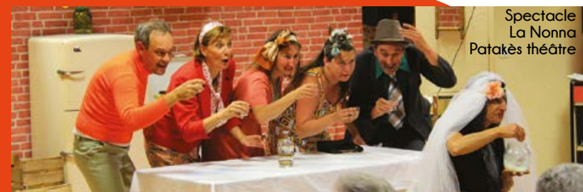
Spéctacle La Nonna Patakès théâtre