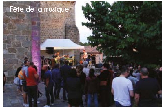
Fête de la musique