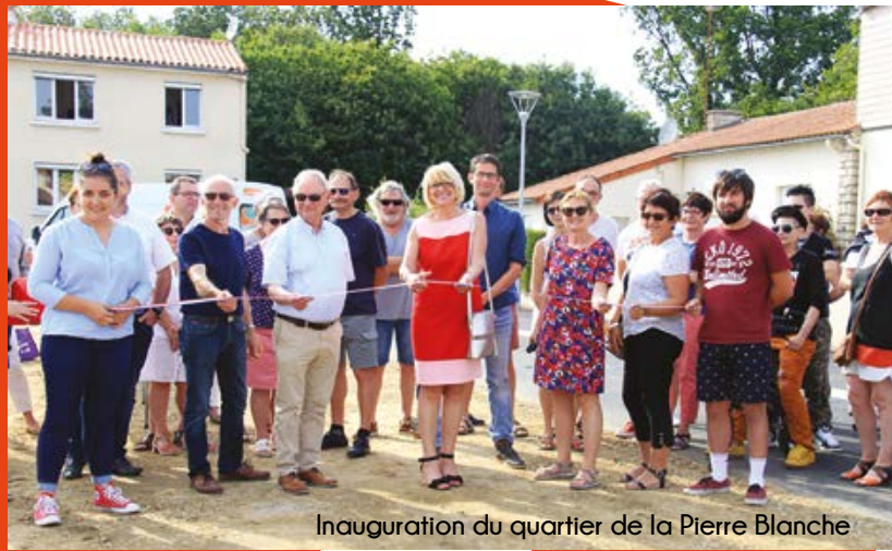
Inauguration du quartier de la Pierre Blanche