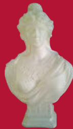
Marianne de la Ville de Pouzauges