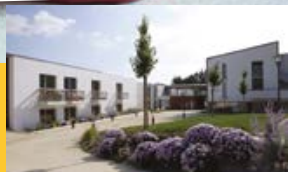
Résidence Les Collines

U ne mutation profonde touche notre société : c'est l'allongement de l'espérance de vie. Si l'espérance de vie était de 40 ans au 19 ème siècle, elle est de 80 ans aujourd'hui. C'est une chance !