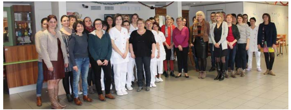
Vœux 2017 à la résidence Les Collines