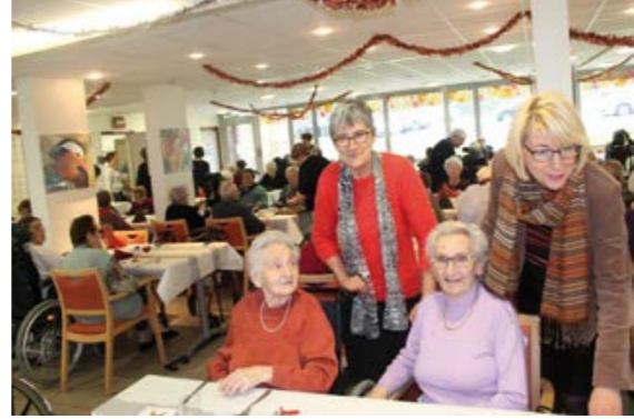
Moment convivial à la résidence Les Collines pour fêter la nouvelle année.