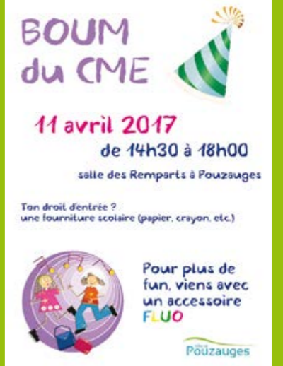
Le premier Conseil Municipal d'Enfants de Pouzauges !

Tu as entre 9 et 12 ans ? Viens danser, rire et t'amuser avec tes amis ! Mardi 11 avril 2017, de 14h30 à 18h, salle des Remparts. Tarif : apporter une fourniture scolaire en bon état... cahiers, règles, trousse, feutres, stylos, crayons de couleur... Le thème ? Je porte une couleur FLUO !!