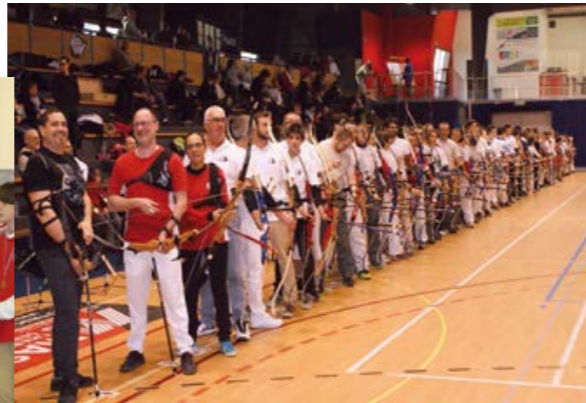
Belle participation pour le concours de tir à l'arc, organisé par les Archers du Bocage en janvier !