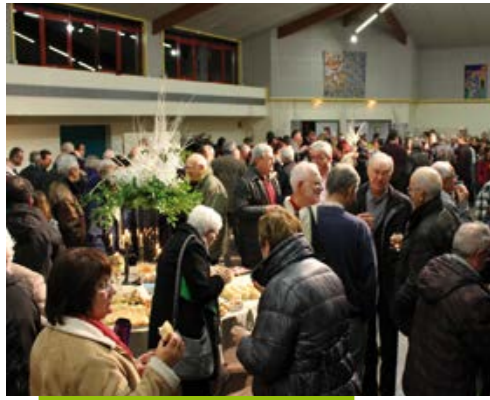
Cérémonie des vœux du maire, l'occasion de dresser un bilan de l'année écoulée et d'annoncer les projets pour 2017.