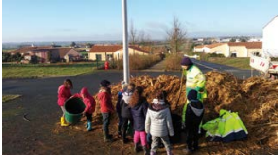
Plantations quartier de la Balière pour les élèves de l'école Jules Verne, encadrés par les agents du service Espaces Verts.