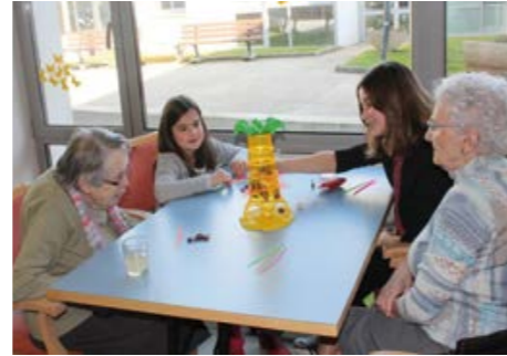
Après-midi jeux intergénérationnels à la résidence Les Collines, organisé par le CME, beau moment de partage... et d'amusements !