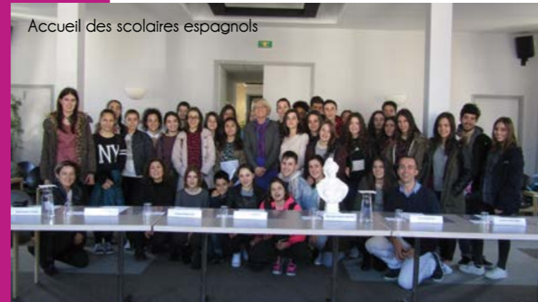
Accueil des scolaires espagnols