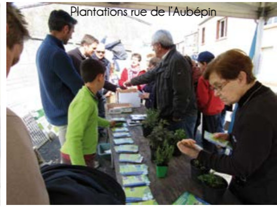
Plantations rue de l'Aubépin