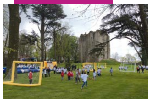
Phénoménal Handball Tour