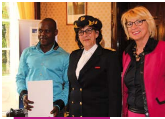
Cérémonie de naturalisation à la préfecture