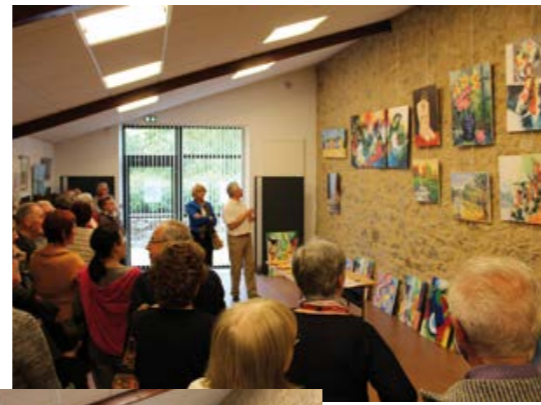
Exposition de l'Atelier d'Art du Colombier