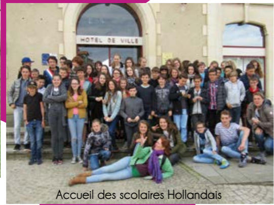
Accueil des scolaires Hollandais