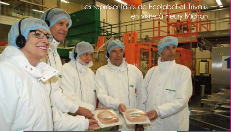
Les représentants de Ecolabel et Trivalis en visite à Fleury Michon