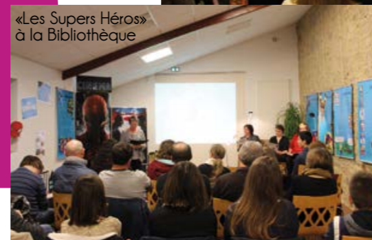
«Les Supers Héros» à la Bibliothèque