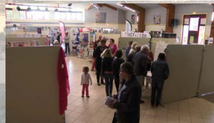
Forum des associations 2015

Renseignements : Mairie de Pouzauges - Tél. : 02 51 57 01 37 oms@pouzauges.fr