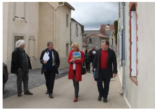
Visite du jury pour le label « Petites Cités de Caractère »