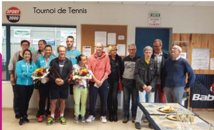
Tounoi de Tennis