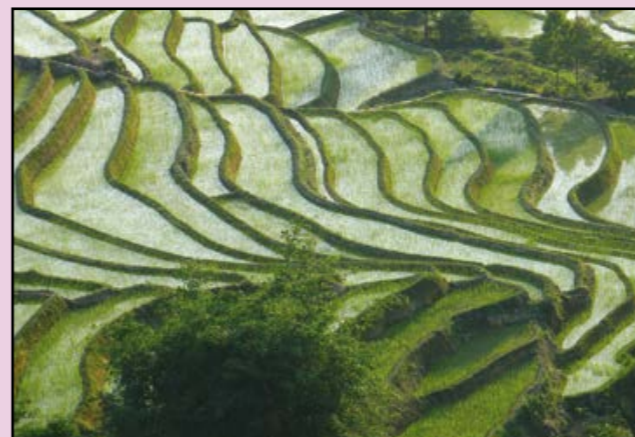
2 ème prix : Jean-Pierre GODET Les rizières en terrasse

Cette année une cinquantaine de photographes amateurs a répondu au thème « Culture(s) et agriculture ».