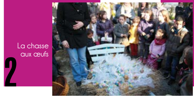
La chasse aux œufs