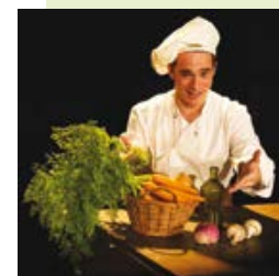
LA GRANDE CUISINE DU PETIT LEON

Jeudi 30 CINE-OPERA « Madame Butterfly » (20h15, Echiquier)