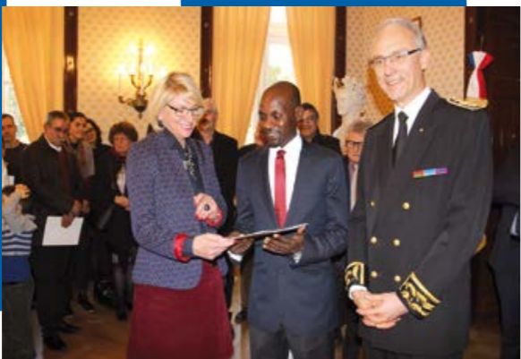
Cérémonie de naturalisation