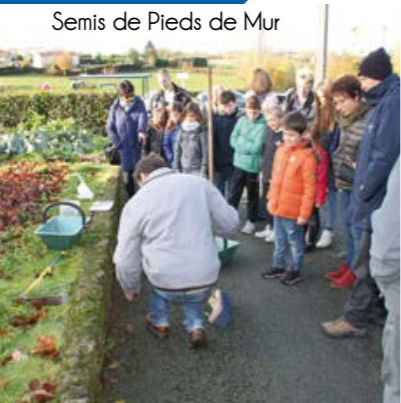
Semis de Pieds de Mur