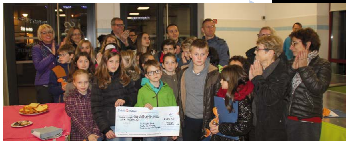
Les enfants des écoles de Pouzauges et du CME, qui à eux seuls ont récolté plus de la moitié des dons !

4734 euros collectés à Pouzauges pour le Téléthon 2016 !