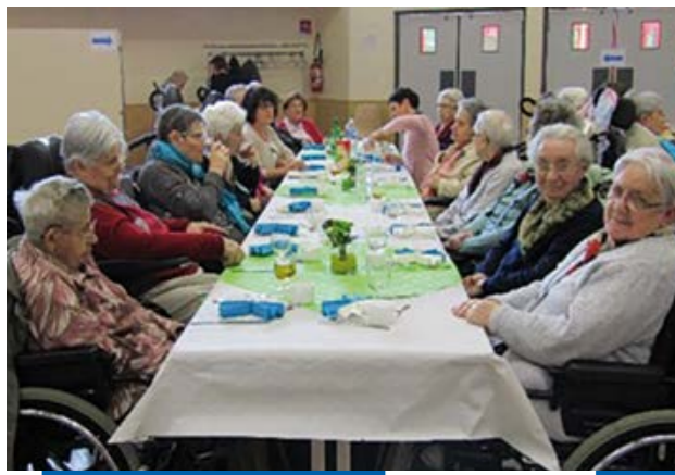
Goûter des aînés