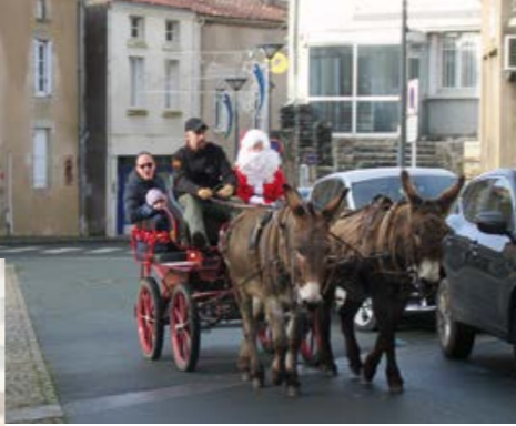
Animations de Noël