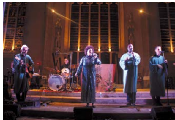
Concert de Noël