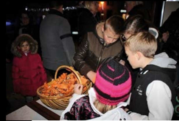
Vente de chocolats au profit du Téléthon