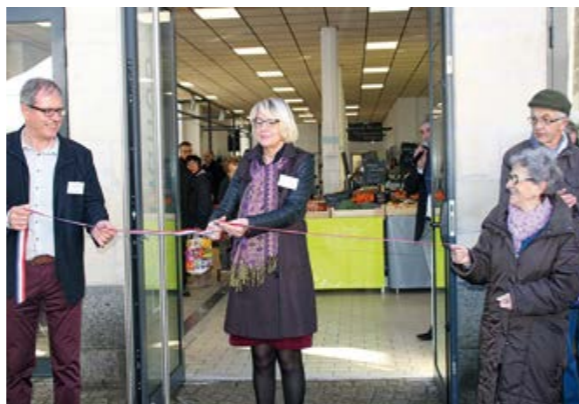
Inauguration des Halles