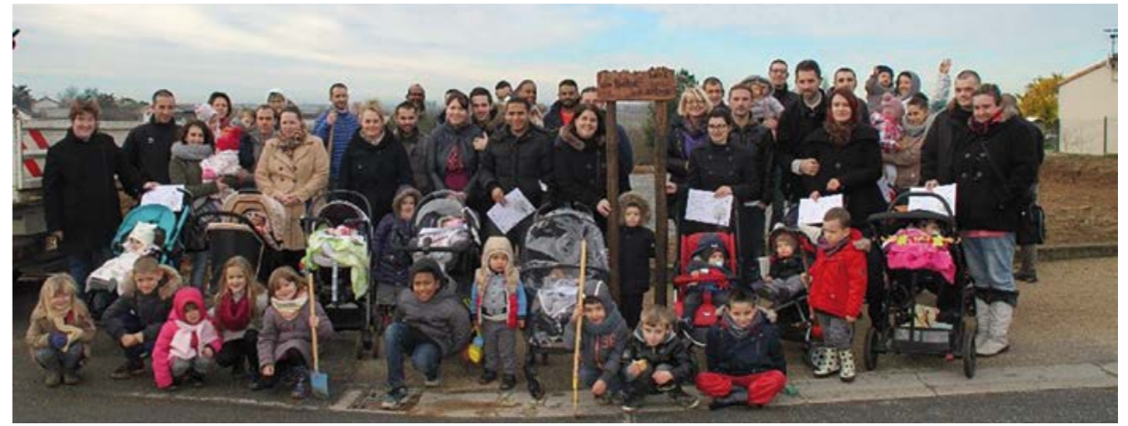
Opération Un bébé, un arbre !