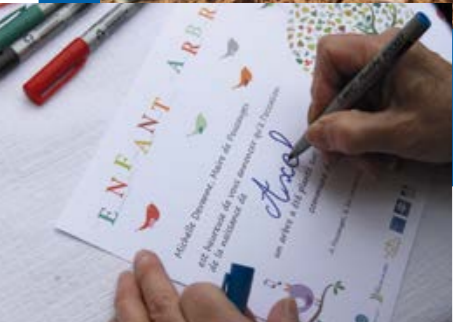
Un bébé, un arbre !