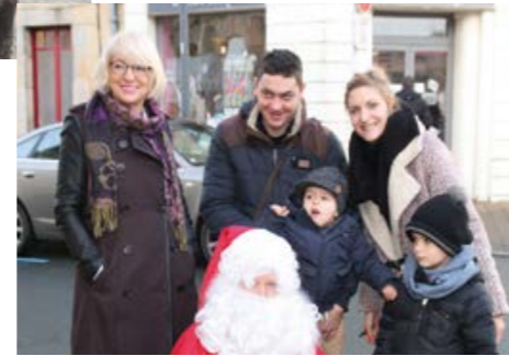
Téléthon 2016 (voir page 24)