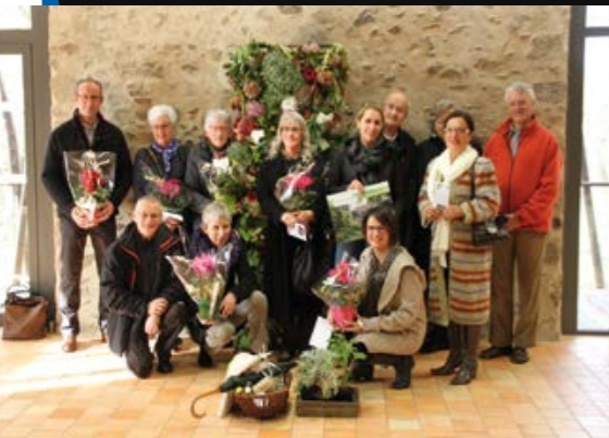
Paysage de votre commune