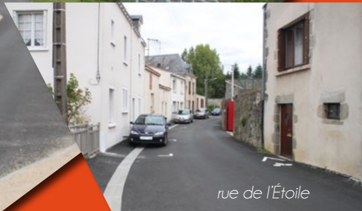
rue de l'Étoile