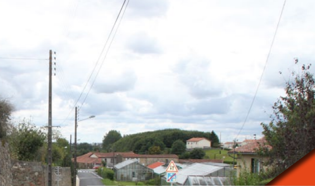
rue de l'Étoile